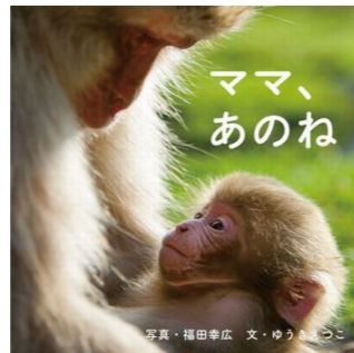
「ママ、あのね」 写真 福田幸広 文 ゆうきえつこ 岩崎書店

とにかくおいしそう！な絵本です。なんだか懐かしい食卓、その日のご飯の参考にもなるかもしれませんよ。食べることへの意欲や、「やっぱりおうちのご飯が一番！」そう思える子育てをしたいですね！