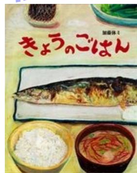
「きょうのごはん」 作 加藤休ミ 偕成社

とにかくおいしそう！な絵本です。なんだか懐かしい食卓、その日のご飯の参考にもなるかもしれませんよ。食べることへの意欲や、「やっぱりおうちのご飯が一番！」そう思える子育てをしたいですね！